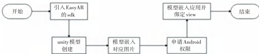
图 2 AR 模型显示流程

为实现用户近距离观赏西湖著名景点、领略西湖独特韵味,通过借助 EasyAR 实现 android 端和 Unity 端的 AR 开发,通过绘制 GLView 实现模型的创建与应用,便捷地将 3DMax 的模型和 Android 端的嵌入相联通,将 3DMax 的模型应用到 AR 板块的扫图功能中 [12] 。使用与创建的主要过程如图 2 所示。