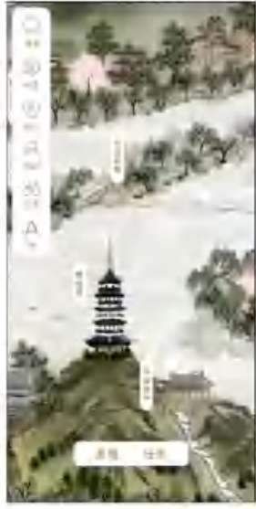
图 6 虚拟地图