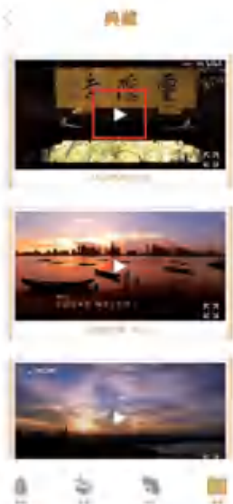
图 5 小窗播放

册和文件位置的记录后,系统会自动进行 apk 的打包并复制到电脑指定文件夹后,便可将 apk 安装到手机上进行测试。当 app 测试完成,便可发布在华为 App 商城等各大平台中,运行效果如图 5、图 6 所示。