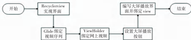
图 3 滑动窗口实现流程图

为便于用户便捷浏览视频、无忧欣赏西湖,系统借助界面设计,在典藏板块呈现出抖音式视频播放界面,加之收藏、点赞和评论等功能。用户可以通过手指上下滑动,快速切换视频,查看心仪视频。同时,视频播放一栏采用 glide 的视频轮播功能,可以迅速定位至当前播放视频,亦可以根据需求选择小窗播放和大屏播放等功能。主要实现流程如图 3 所示。